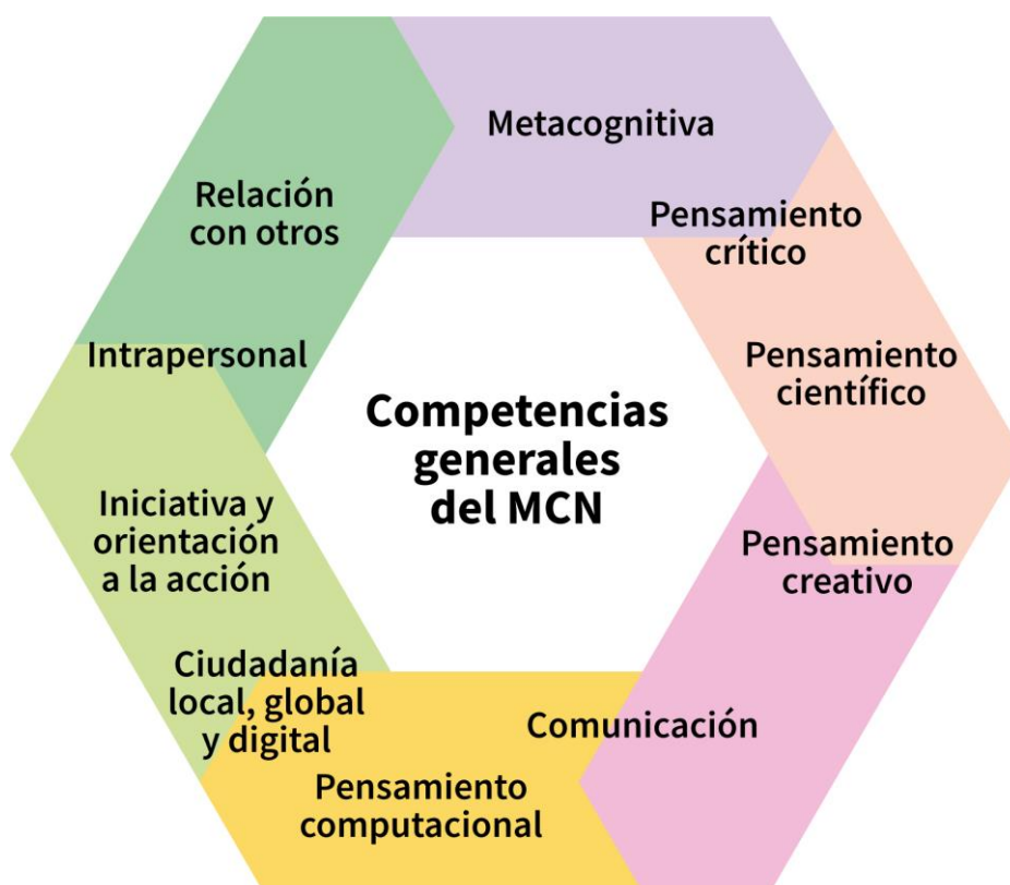
Figura 1: Interrelación entre las competencias del Marco Curricular Nacional

Dichos contenidos estructuran y apuntan, de manera integrada, al desarrollo de las actividades de la lengua en relación con las competencias expuestas por el Marco Curricular Nacional representados en la siguiente figura.