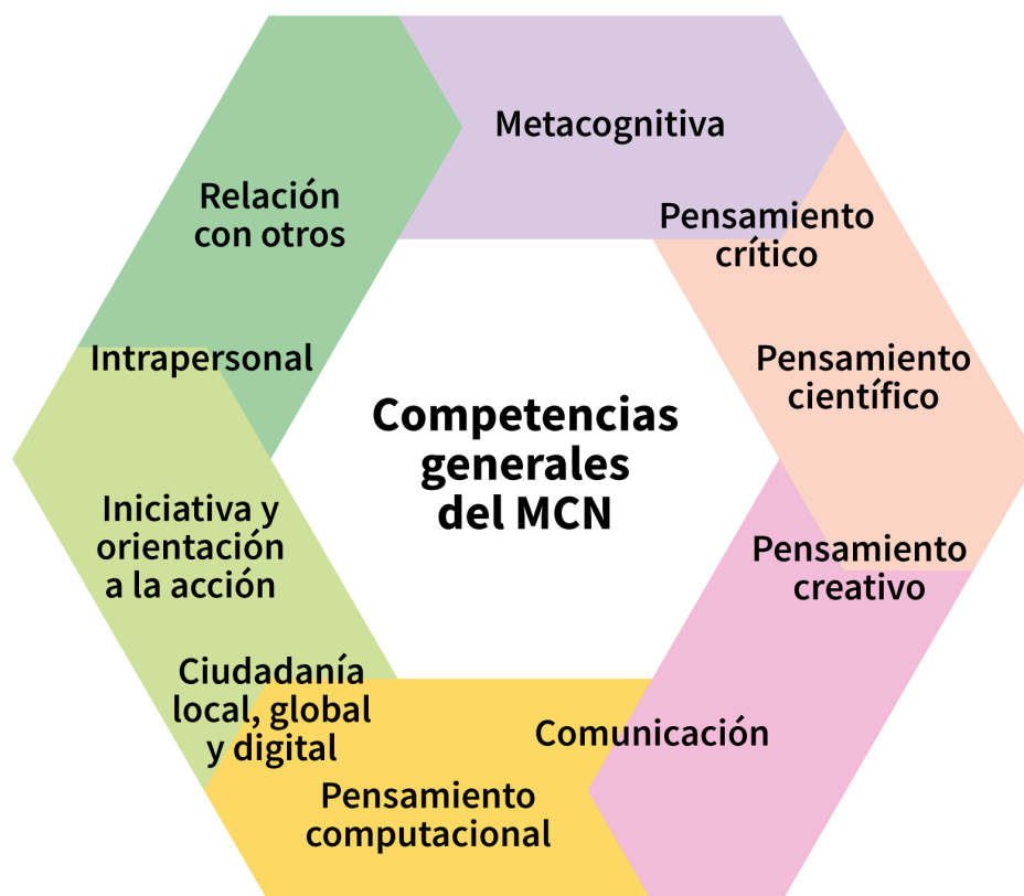
Figura 1: Interrelación entre las competencias del Marco Curricular Nacional

Dichos contenidos estructuran y apuntan, de manera integrada, al desarrollo de las actividades de la lengua en relación con las competencias expuestas por el Marco Curricular Nacional representados en la siguiente figura.