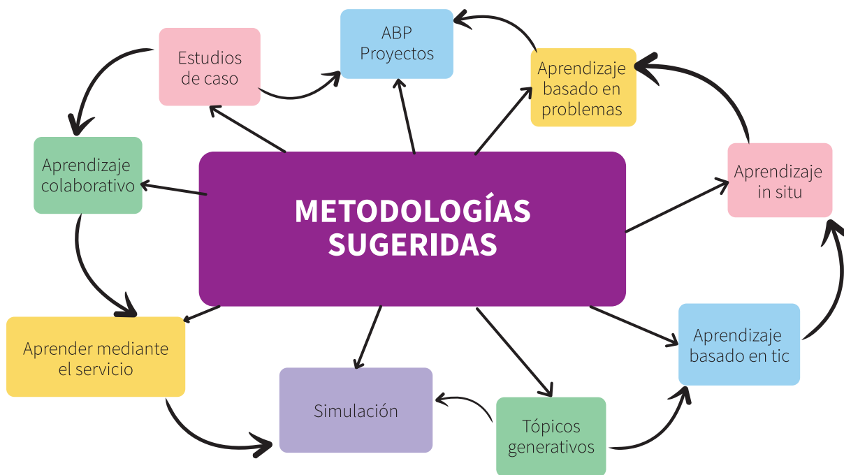
Figura 3. Principales metodologías para la formación de competencias

Elaboración propia con base en Pimienta (2012, pp. 36 -39)