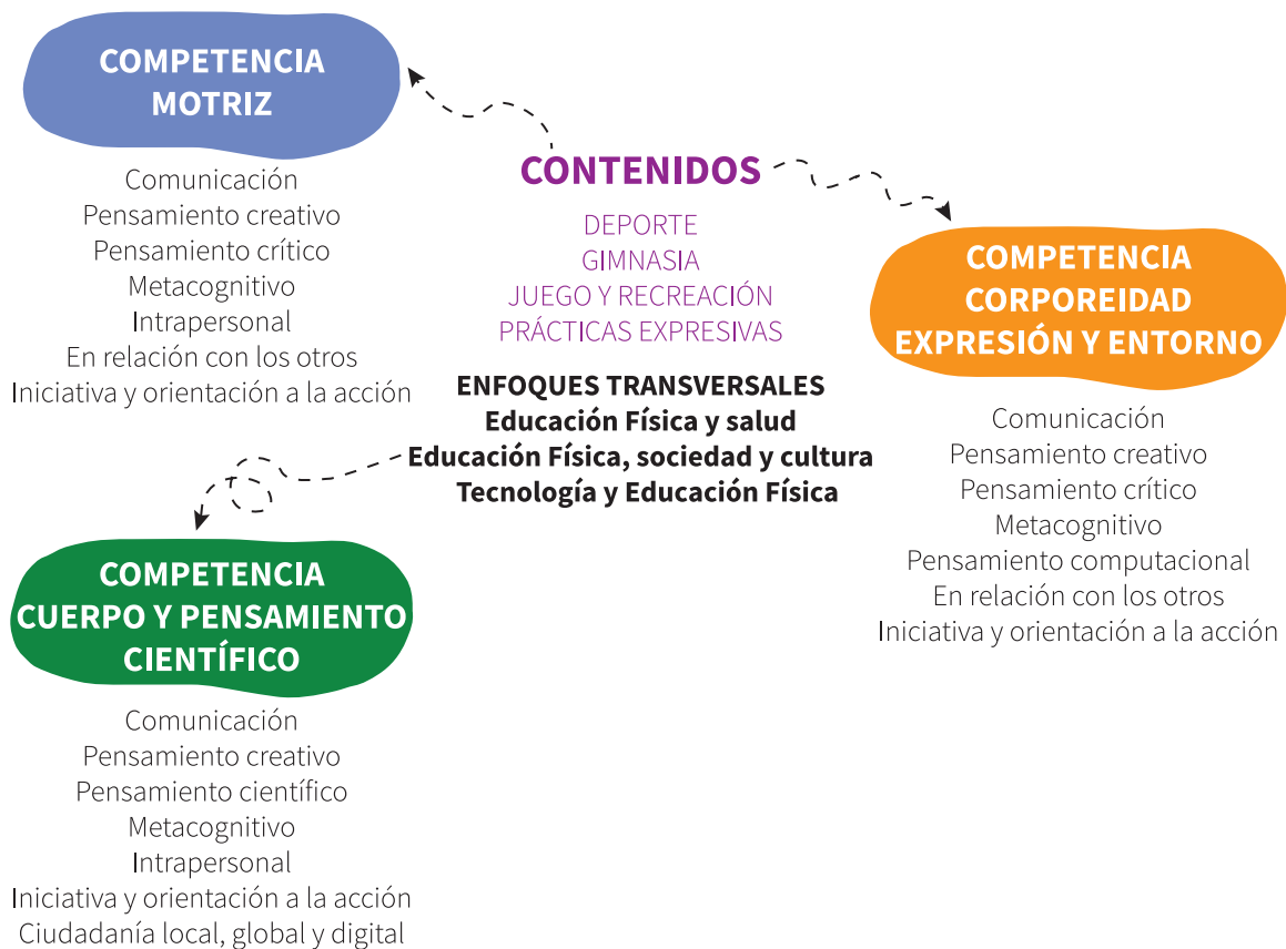
Figura 2. Relación entre Competencias generales, específicas, contenidos y enfoques desde el campo de la Educación Física en clave ANEP

Por último, se presenta la relación dinámica entre contenidos estructurantes, enfoques, competencias específicas y competencias generales de la EBI del MCN.