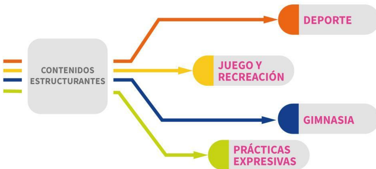
Figura 3. Contenidos específicos